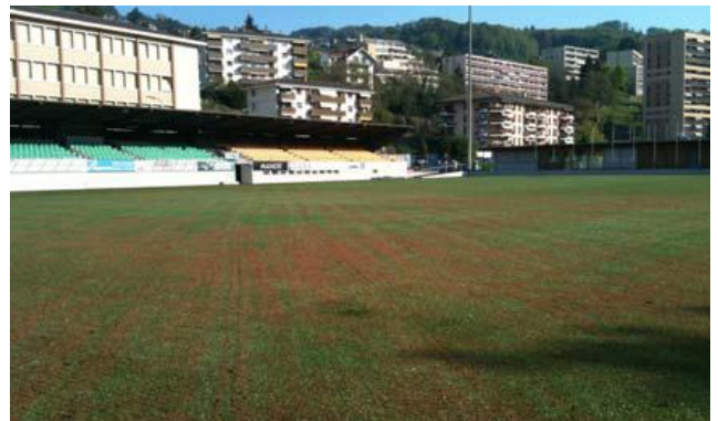
Der Kunstrasen wird mit organischen Elementen aufgefüllt (links), danach wird angesät (rechts)