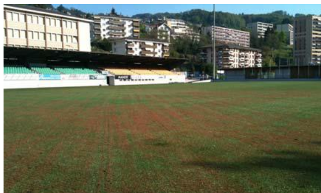
Remplissage du gazon synthétique avec des matériaux organiques et l'ensemencement