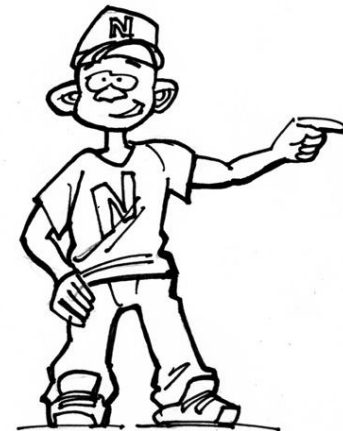
Netzli - Der Sportkoordinator