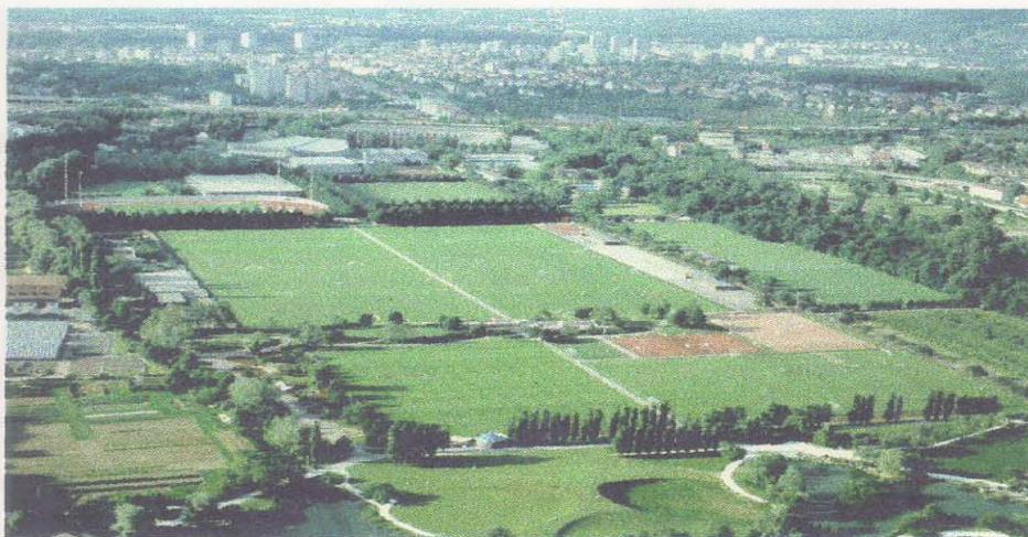
Luftaufnahme ca. 1993