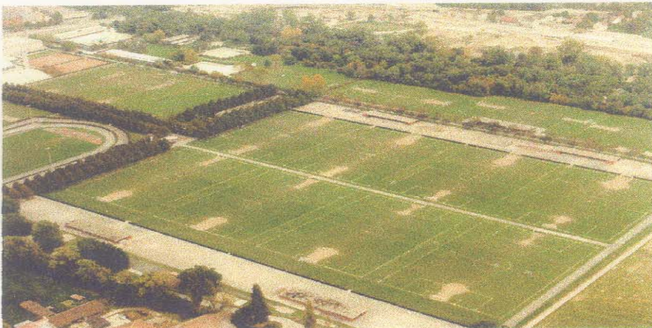
Luftaufnahme ca. 1978